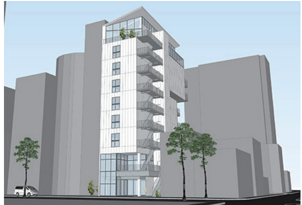
外観イメージ図「ナインアワーズ博多駅前（仮称）」