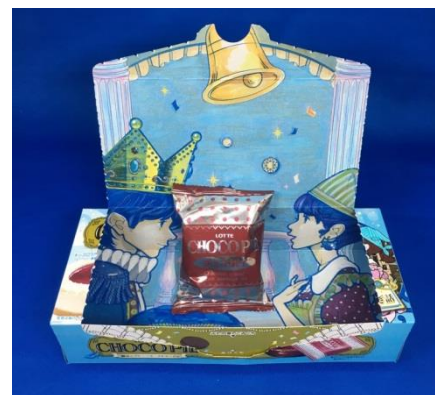
好きなものをのせて写真撮影