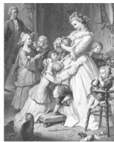
社名の由来である “若きウェルテルの悩み”のヒロイン 「シャルロッテ」