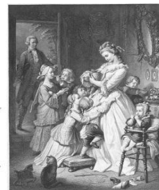
社名の由来である “若きウェルテルの悩み”のヒロイン 「シャルロット」