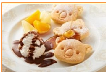
コアラのマーチパンケーキ