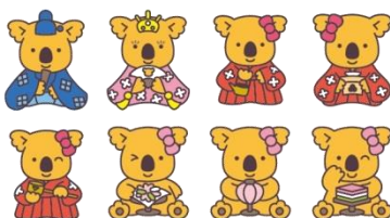
ひなまつり関連絵柄(全8種類)