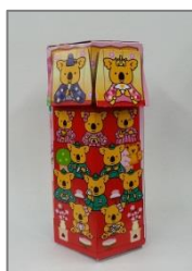
ひなまつりキットのひな飾りの例