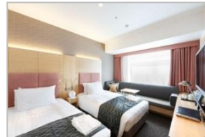
ツインルーム(8階～13階)