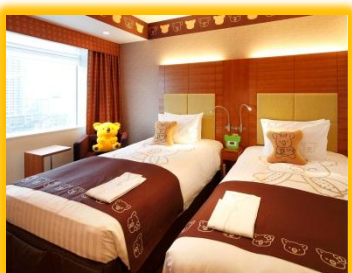
コアラのマーチルーム① マーチくん部屋(全2室)

ロッテ大人気のお菓子「コアラのマーチ」のキャラクターとコラボレーションしたファミリーに大人気のお部屋です。