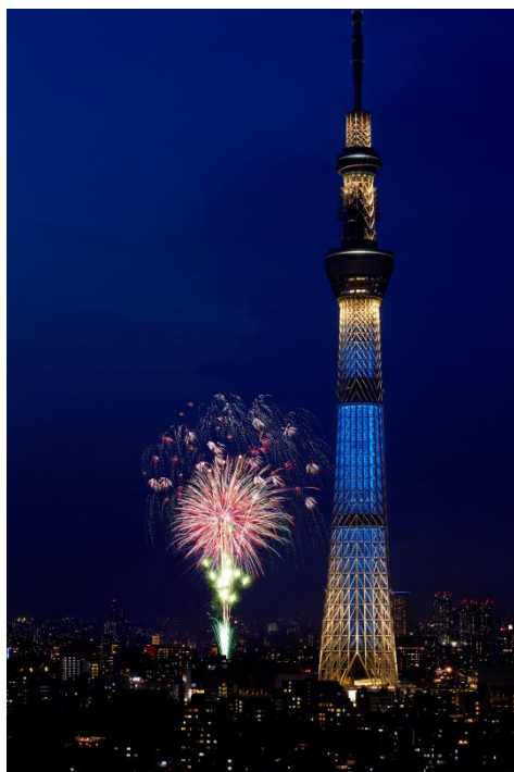
2012年7月29日第35回隅田川花火大会 ～ロッテシティホテル錦糸町より撮影

ロッテシティホテル 錦糸町では、2016年7月30日開催の「第39回隅田川花火大会」に向けて、この花火大会を客室からお楽しみいただける＜隅田川花火大会宿泊プラン＞の予約を6月5日(日)13時より受付開始いたします。