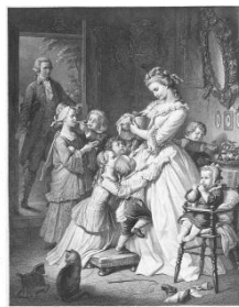
社名の由来である “若きウェルテルの悩み”のヒロイン 【シャルロッテ】