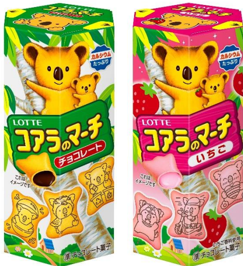
コアラのマーチ<チョコ>