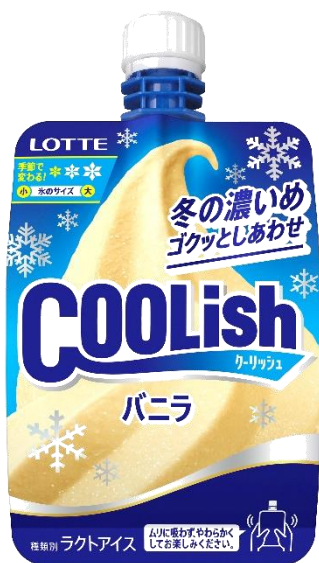
冬季限定<冬の濃いめ>