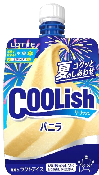
夏季限定<夏のゴクツとしあわせ> ※2024年夏季発売商品