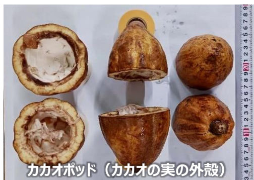
カカオポッド（カカオの実の外殻）