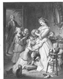
社名の由来である “若きウェルテルの悩み”のヒロイン 「シャルロッテ」