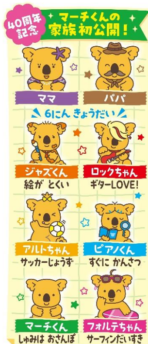
※パッケージのイメージ図