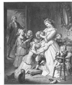
社名の由来である “若きウェルテルの悩み”のヒロイン 「シャルロット」