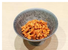
肉味噌(大豆ミート使用)