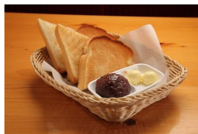
小倉あんで有名な コメダ珈琲店が監修