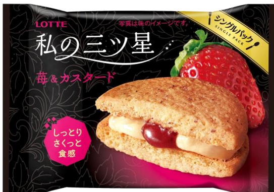
しっとりさくっと <苺&カスタード>