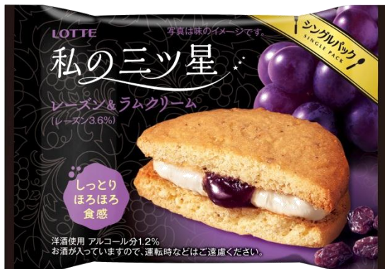
しっとりほろほろ <レーズン&ラムクリーム>

ロッテでは、「シングルパック」シリーズ(1個売り)から上質感やこだわりを大切にしたいスイーツ『私の三ツ星』2品を、4月21日に新発売いたします。家事や仕事の合間にホッと一息、癒しの時間を提供する自分の為のご褒美スイーツとして開発いたしました。