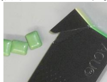
＜片手でできる開閉口＞

4. 片手で開閉でき、移動中でも使いやすい 機能的なパッケージです。裏面には便利な 捨て紙もついています。