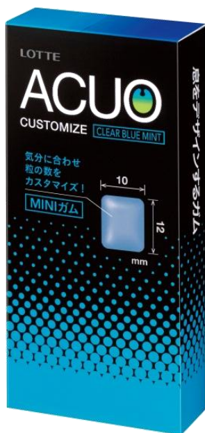
クリアブルーミント