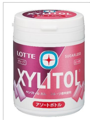
『キシリトール ガムフルーツアソートファミリーボトル』も同時発売！