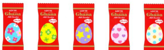
個包装表面のイメージ