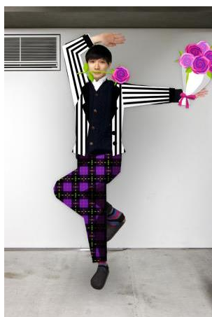
【グレープミックス】