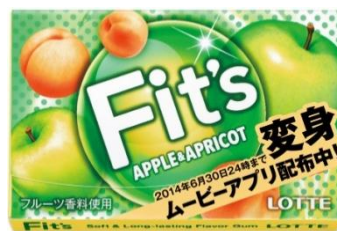
〈アップル&アプリコット〉