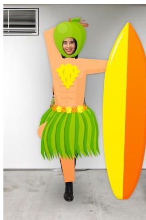
【アップル&アプリコット】