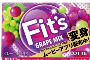
〈グレープミックス〉