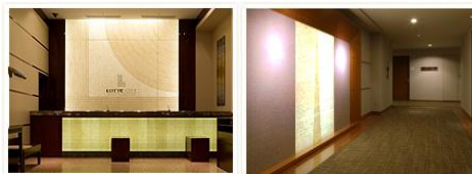
「ロッテシティホテル錦糸町」 フロント・エレベーターホール光壁(2010年)

「ロッテシティホテル錦糸町」フロント・エレベーターホール光壁(2010年)をはじめ、アメリカ、ニューヨークのカーネギーホールでの「YO-YO MAチェロコンサート」の舞台美術など海外でも活躍。インテリアプランニング国土交通大臣賞、ウーマン・オブ・ザ・イヤー2003、日本現代芸術奨励賞など多数受賞。