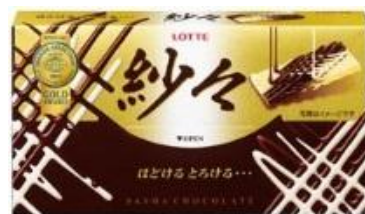
※昨年度のパッケージ