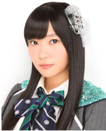
指原 莉乃 (さしはら りの)