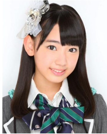
宮脇 咲良 (みやわき さくら)