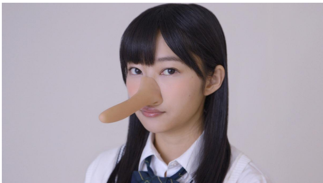
新TV-CM「でっかくなっとーと」篇より

また、専用ウェブサイト「HKT48ガムマジック部@CGB」(URL: http://crazygum.tv/gummagic/ ) を開設し、「でっかくなっとーと」篇に加え、部員が披露するガムマジック動画を2013年7月16日(火)より公開いたします。