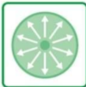
STEP 3 口の水分を吸って 膨張