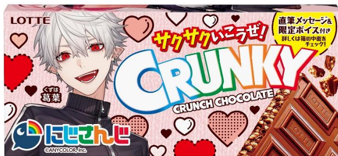
■クランキー にじさんじデザイン

株式会社ロッテは1月31日(火)に、サクサクいこうぜ！の「クランキー」シリーズから『クランキーにじさんじデザイン』『クランキーポップジョイ にじさんじデザイン』を発売いたします。クランキーで初となるVTuberとのコラボとなる本商品では、12人のライバーがそれぞれのパッケージに登場するほか、『クランキー にじさんじデザイン』では、中面を開くとライバーの直筆メッセージが現れたり、QRコードから限定ボイスをゲットできたりします。また、『クランキーポップジョイ にじさんじデザイン』のパッケージは、特別な描きおろしデザインです。サクサクおいしく、眺めて聞いて楽しい！にじさんじデザインの本商品を、ぜひおためしください。