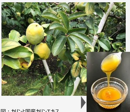
図：カリンと国産カリンエキス