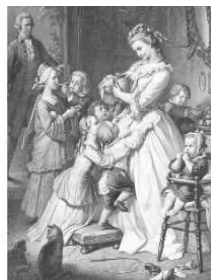
社名の由来である “若きウェルテルの悩み”のヒロイン 「シャルロット」