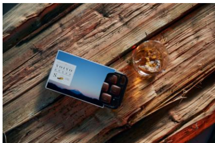
地元の林業会社が敷地内で薪わりをして使用する蒸留器W専用の薪