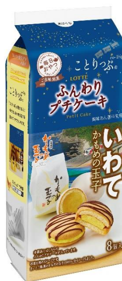
『ことりっぷ ふんわりプチケーキ <かもめの玉子>』