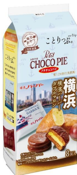
『ことりっぷ プチチョコパイ <横濱ハーバー ダブルマロン>』

株式会社昭文社発行の「ことりっぷ」を持って、まるでおうちにいながらも旅したような気分を疑似体験できるコラボレーション第4弾です。ぜひおうちにいながらも、旅したような気分でお楽しみください♪