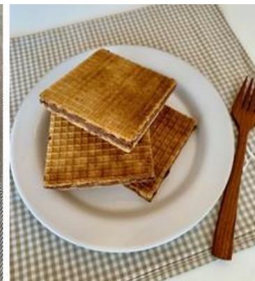
「焼きビックリマンチョコ」