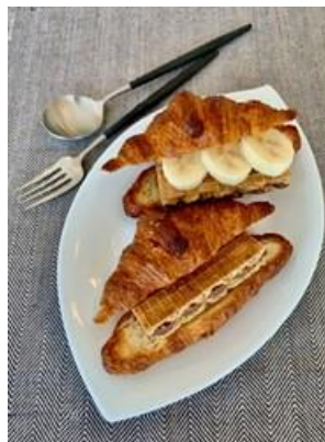
「“ビックリ”クロワッサン」