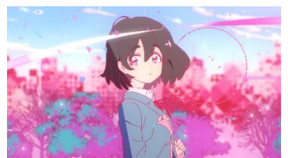
優柔不断な桃（ピンク）