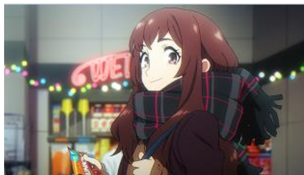
主人公たち：ロッテのお店で出会う少年と少女