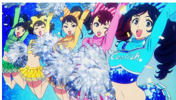
クーリッシュの精