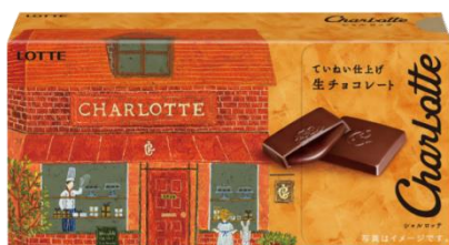
シャルロット 生チョコレート