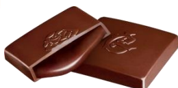
シャルロット 生チョコレート<バニラ>