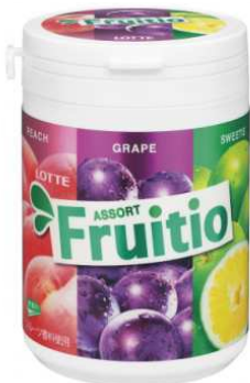
『フルーティオ アソートスリムボトル』