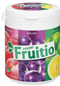
『フルーティオ アソートファミリーボトル』