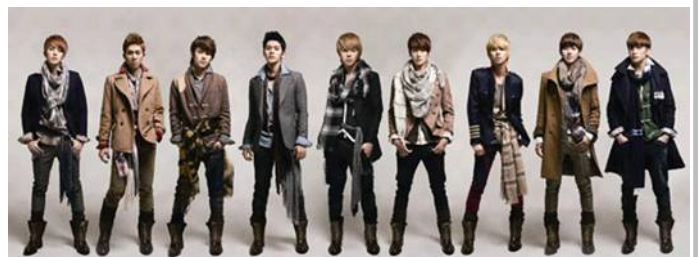
※画像はイメージ(メンバー9人が揃った写真に全員の直筆サインが入ります)