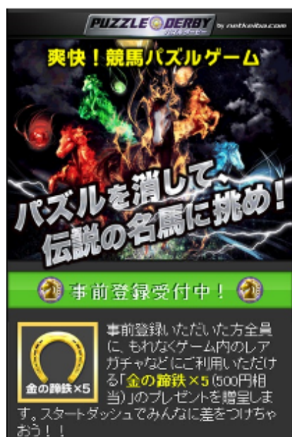
事前登録キャンペーン TOP 画面