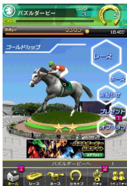
『パズルダービー』TOP 画面