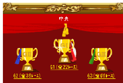
“メモリアルルーム”

ネットドリーマーズは、このたびの『うस्ता★名馬伝説』をはじめとして、今後も、より多くのユーザーに楽しんでいただける魅力的なソーシャルゲームを提供してまいります。同時に、コミュニティ総合メディア『モバKR』のプラットフォームにおいては数々のソーシャルゲームをサービス展開してゆく所存です。