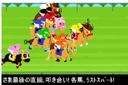
“レース”では実名馬がライバル