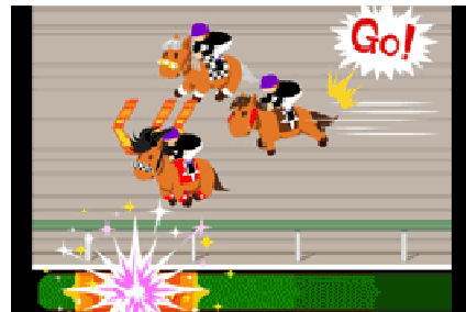
“調教”して愛馬をトレーニング