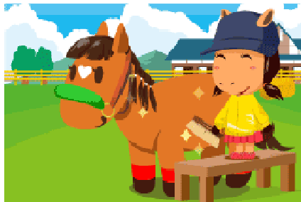
“お世話”で愛馬の体調管理