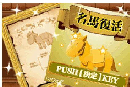
“血統書”を集めて名馬を復活!