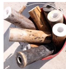
汚れが酷いものも