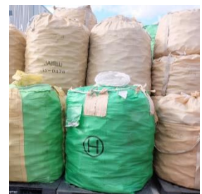
【回収されたカートリッジ】

回収された浄水カートリッジはまず高知県南国市のリサイクル工場に運ばれます。1週間で約 6000 本が届きます。(中にはお礼状や子供たちからのメッセージなども添えられて返送されるケースもあります)