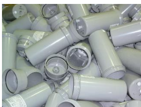
【プラスチックケース】