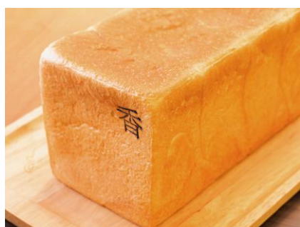
▲銀座の食パン～香～ 1,000 円税込