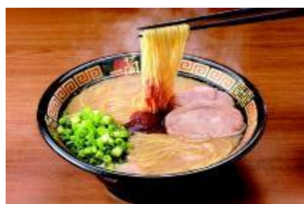
▲天然とんこつラーメン (創業以来) 「赤い秘伝のたれ」がさらなる深みを加える