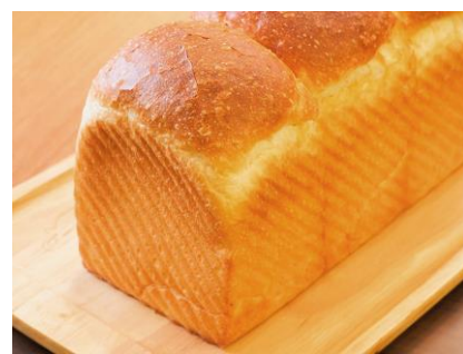
▲山型の食パン 900 円税込