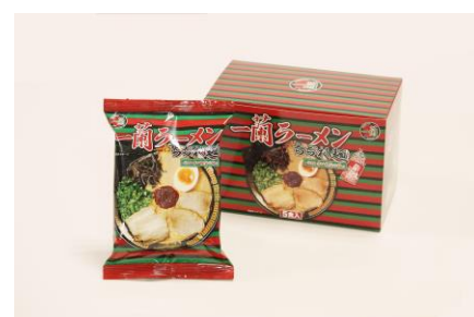
▲お土産 一蘭ラーメンちぢれ麺 一蘭特製赤い秘伝の粉付