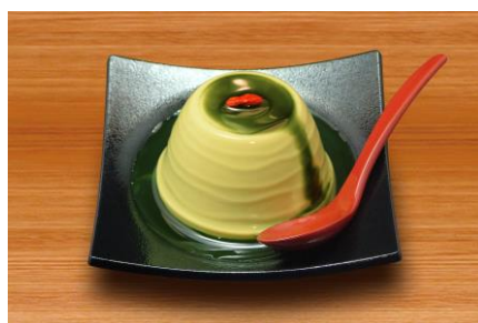
▲抹茶杏仁豆腐 優先案内サービスプランのデザート