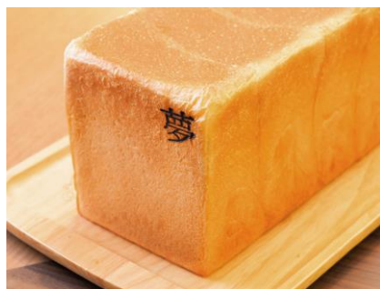
▲銀座の食パン～夢～ 900 円税込