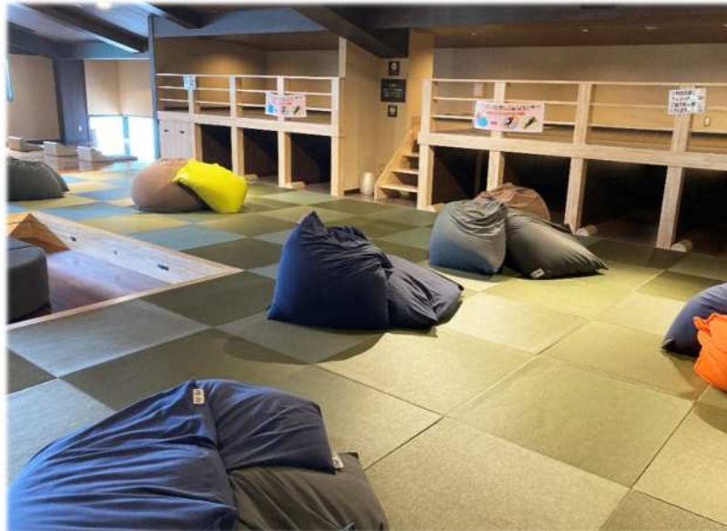
「癒し蔵」巣ごもりコーナー

癒し蔵は、湯上がり後、リラックスいただけるスペースです。「温暖ルーム」は常温+2~3 に空調管理し、入浴で温めた深部体温を維持し新陳代謝を高めます。本館にある天然温泉と炭酸泉のコラボ風呂「癒しの湯」入浴後にご利用いただくと、より効果が高まるといわれています。また、「巣ごもりコーナー」では、琉球畳やヨギボー®に寝転がってリラックスした中、約10,000冊のマンガを楽しめます。マンガは皆さまからのリクエストを参考に、定期的に入れ替えています。