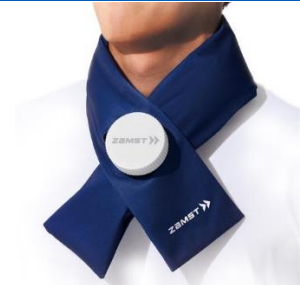
▲「ザムスト アイスバッグ 首用」を再販決定