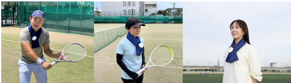
▲運動時や観戦時の使用イメージ

ザムストは、暑熱下でのスポーツ活動に取り組む際に、暑さや紫外線によるダメージを抑えて快適性を向上させるアイテムを各種ラインアップしております。手持ちタイプのアイスバッグ(氷のう)は以前より販売しておりましたが、「手を塞がずに首元を冷やしたい」というご要望にお応えし、首巻きタイプの氷のう「ザムスト アイスバッグ 首用」を2024年に発売いたしました。ハンズフリーで快適に冷却できる点が、運動時や観戦時の暑さ対策アイテムとして昨年は暑さが本格化する前に完売になるほど大変好評でした。そこで、今年はさらに多くのお客様にお届けできるよう、生産数量を昨年の5倍に増やし、再販することを決定いたしました。