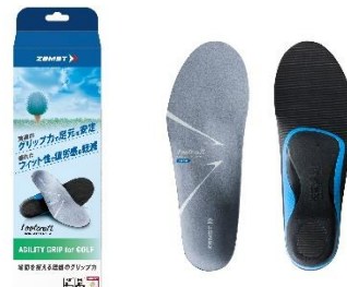
▲新たに発売する Footcraft AGILITY GRIP for GOLF

スポーツ向けサポート・ケア製品ブランド「ZAMST(ザムスト)」を展開する、日本シグマックス株式会社(本社:東京都新宿区、代表取締役社長:鈴木 洋輔)は、「Footcraft(フットクラフト)」シリーズより、地面を捉える理想のグリップ力を実現したゴルフ向けインソール「AGILITY GRIP for GOLF(アジリティ グリップ フォー ゴルフ)」を2025年3月5日(水)より新たに発売いたします。