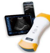
ポケットエコー miruco CL5