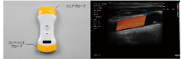
▲(左)プローブ画像、(右)カラードプラ使用イメージ(頸動脈)

コンベックスとリニアプローブを一体化したデュアルプローブと、血流を視覚的に表示するドプラ機能の搭載により、1台で幅広い領域/部位へ使用可能。