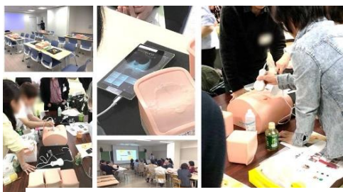
▲エコーセミナーの様子

日本シグマックスは、2016年に『いつでも、どこでも、すぐに診る』を製品コンセプトとしたタブレット型の超音波画像診断装置「ポケットエコー miruco」を発売いたしました。