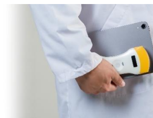
▲幅広いシーンで活用可能

医療現場での利便性をさらに向上させ、診療の質を向上させるための有力なツールとして医療従事者の皆さまをサポートいたします。