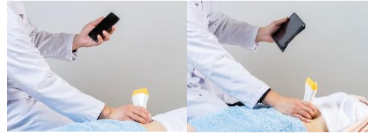
▲表示器は自由に選択可能(左:スマートフォン、右:タブレット)

※セット品にタブレットやスマートフォンなどの表示器は含まれません。表示器は iOS のスマートフォン、タブレットをご用意ください。