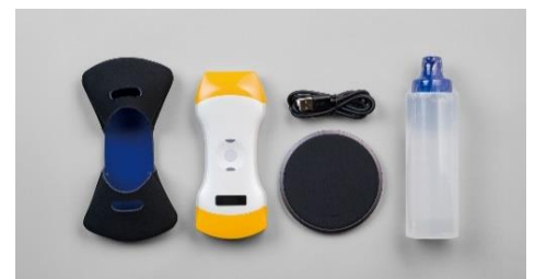
▲セット品: 左から保護カバー、プローブ、USB ケーブル、ワイヤレス充電器、超音波ゲル、スタートアップガイド(画像無し)

保証プラン(安心 3 年サポート)… ¥115,500(税込) ※本体価格に付加