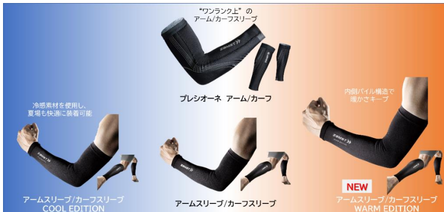
▲ザムストコンプレッション製品 ラインアップ一覧

ザムストのアームスリーブやカーフスリーブユーザーから、「冬場、スリーブを身に着けていても寒い」、「保温機能が備わっていたら嬉しい」といったお声を頂いており、寒い時期でも快適にスポーツを行うことができるよう、保温性に優れたコンプレッション製品「アームスリーブ WARM EDITION」、「カーフスリーブ WARM EDITION」を発売する運びとなりました。