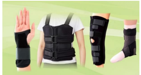
▲ハイブリッドシーネシリーズはこれまで4製品ラインアップ

当社は創業当初から整形外科向けサポーターとギプス包帯を製造・販売してまいりました。その中で寄せられた「スピーディーにギプス処置をしたい」、「ギプス固定をしている期間、患者様の日常生活に生じる不便を少なくしたい」といった医療現場からのご要望にお応えし2017年に専用ギプスシーネと膝サポーター型のシーネホルダーがセットになった、「ハイブリッドシーネ ニー」を発売いたしました。