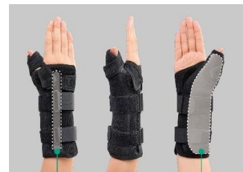
▲専用シーネとステーの配置

「ハイブリッドシーネ サムスパイカ」は、専用シーネをシーネホルダーにセットして装着するだけでスピーディーなギプス処置が可能です。また、手のひら側の専用シーネと、手の甲側のアルミステーを配置したシーネホルダーを採用し、母指・手関節の固定に必要なサポート力を備えています。さらに、シーネホルダーはオープンタイプ設計で装着しやすいデザインにし、実際に装着される患者様の快適性も考慮いたしました。