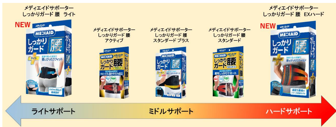
▲サポートタイプ別 メディエイド腰サポーター分類

その中で、「デスクワークや家事など、日常生活でも気軽に装着できてフィットする製品が欲しい」、「仕事上、腰を酷使するので、固定力は高く、装着時のズレ上がりやムレを軽減した製品があると助かる」といったお声を頂いており、そのご要望にお応えすべく、この度、「メディエイドサポーター しっかりガード 腰」シリーズへ、新たに「ライト」、「EX ハード」の 2 製品をラインアップする運びとなりました。