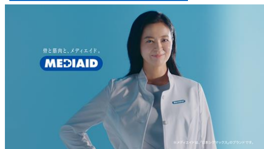
▲MEDIAID ブランドアンバサダー 黒谷友香さん

※1: (株)日本能率協会総合研究所調べ。2022 年度メーカー出荷額ベース ※2: (株)日本能率協会総合研究所調べ。2022 年度メーカー出荷枚数ベース