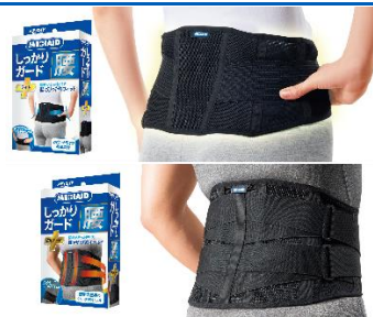
▲新たに発売するメディエイドサポーター しっかりガード 腰 ライト(上)、EX ハード(下)

なお、本 2 製品は、2024 年 8 月 5 日(月)より出荷開始いたします。