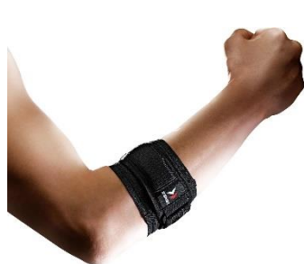
▲ ゴムスト エルボーバンド