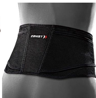
▲ ゴムスト ZW-4