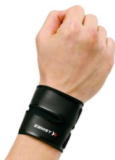
▲ ゴムスト FILMISTA WRIST

ゴムストでは、当社のルーツである腰用サポーターをスポーツ用に最適化した「ZW シリーズ」をはじめとした、各関節用サポーター、足裏をサポートする「機能性インソール」など豊富にラインアップしております。製品を通して、自己ベストスコアの更新に果敢に挑戦するゴルファーを応援し、サポートします。