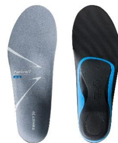
▲ ゴムスト Footcraft AGILITY GRIP