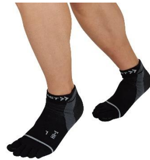
ZAMST HA-1 メッシュ <5本指>