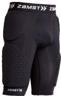
ZAMST BRAVE-PAD SHORTS