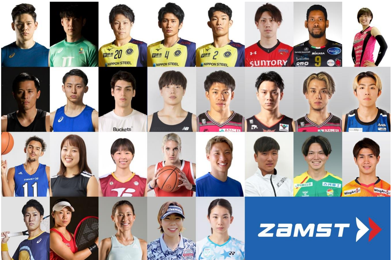
バレーボール: 西田有志、小野寺太志、山本智大、高野直哉、樋口裕希、大宅真樹、ウィルフレド・レオン、佐々木千紘/ バスケットボール: 富樫勇樹、河村勇輝、シェーファー アヴィ 幸樹、西田優大、保岡龍斗、津屋一球、伊藤駿、寺嶋恭之介、トレイ・ヤング、山本麻衣、東藤なな子、エレナ・デレ・ダン／サッカー: 畠中楨之輔、鶴木郁哉、小林祐介、佐藤亮／テニス: 綿貫陽介、日比野菜緒／マラソン: 岩出玲亜／ゴルフ: 穴井詩／バドミントン: 松友美佐紀 他アスリート・チーム多数

ZAMST はバレーボール、バスケットボール、サッカー、テニス、マラソン、ゴルフ、バドミントン、など、あらゆるスポーツにおいて限界に挑み続けるアスリートや団体を応援しています。