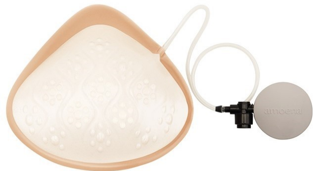
製品外観(肌に触れる側)