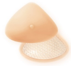
温度調整素材Outlast® 配合シリコン

アモエナの専用ブラジャーは自然なつけ心地で、女性らしさも感じていただけます。プレストフォームをしっかりと支え安心してつけていただけるように、デザインされています。