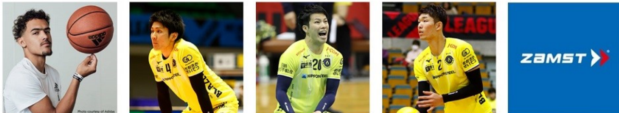
トレイ・ヤング選手(バスケットボール)、高野 直哉選手(バレーボール)、山本 智大選手(バレーボール)、樋口 裕希選手(バレーボール)、その他、アスリート、チーム多数。